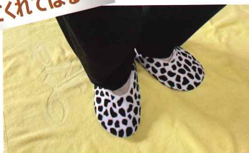
桂学区在住の80代女性