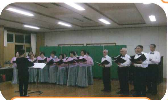
山の手倶楽部 「桂坂混声合唱団」