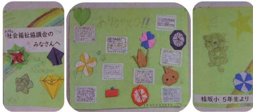
桂坂小学校「地域の安心・安全感謝の会」 5年生より手作りの心温まる感謝状をいただきました。

今後も安心して暮らせる住みよい街づくりに、一層の充実を図るよう努力してまいりますので、ご支援・ご協力の程お願い申し上げます。