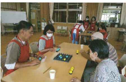
すこやかサロン (クローバーホール) 概ね 第3土曜日 10:00~