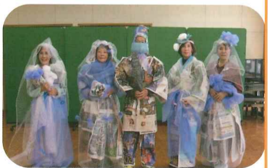
新聞紙ファッションショー