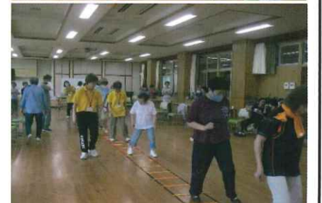
筋トレ教室(クローバーホール) 概ね 第2日曜日 10:00~