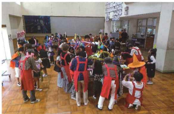
桂坂小学校PTAフェスティバル バルーンアート(犬・サーベル)で出展。 たくさん子どもたちが来てくれました。