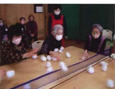
すこやかサロン (クローバーホール) 概ね 第3土曜日