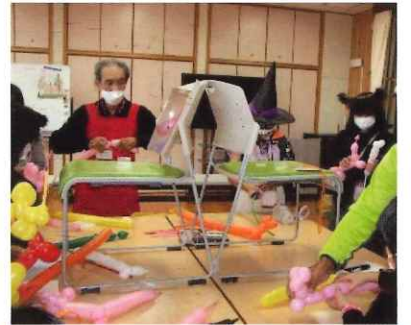
桂坂小学校PTAフェスティバルにて、犬とサーベル合わせて700個のバルーンを作りました。