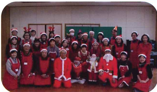
クリスマス会時のボランティアの皆さん