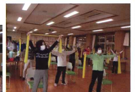
筋トレ教室 (クローバーホール) 概ね 第2日曜日 10:00~