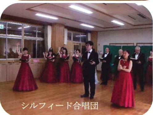
シルフィード合唱団