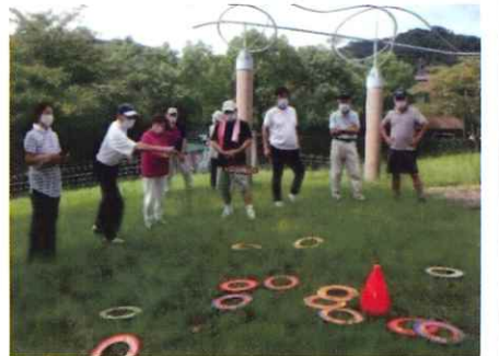
スカイクロス (ふれあい公園) 第1・第4水曜日 (10:00~)