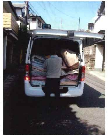
布団クリーニング、2024年は10月30日31日に行います。