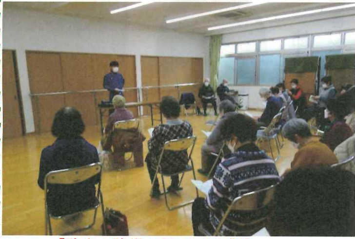
「防火・防災」について講演