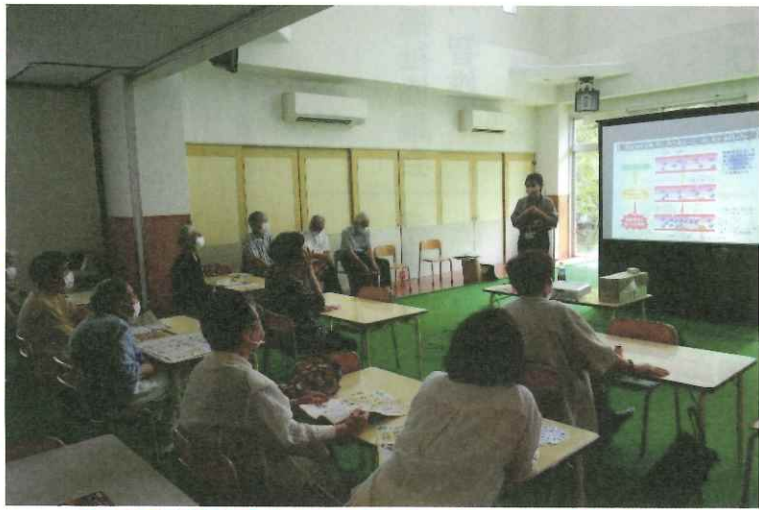
「生活習慣病とその予防」について講演