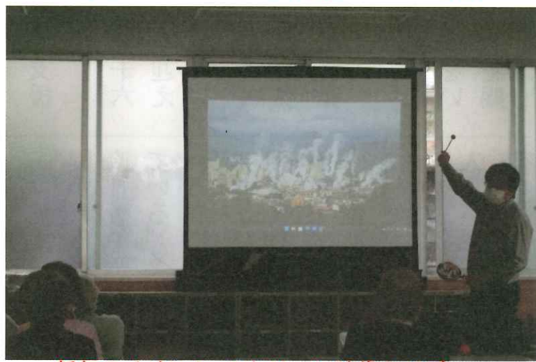
新年のイベント スクリーン映像クイズ