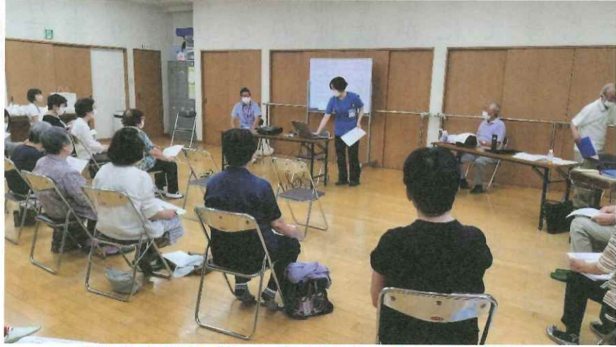
「脳卒中のサイン～在宅看護」について講演