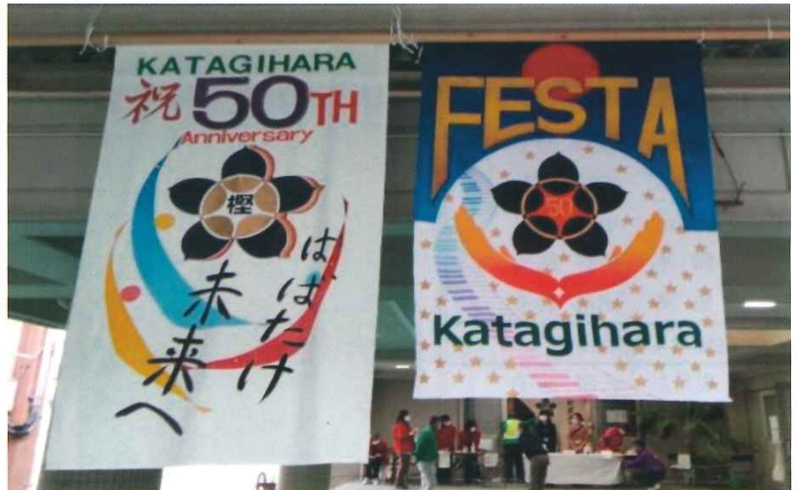
自治連合会主催「フェスタかたぎはら」11月13日（日）開催 場所 榎原小学校体育館