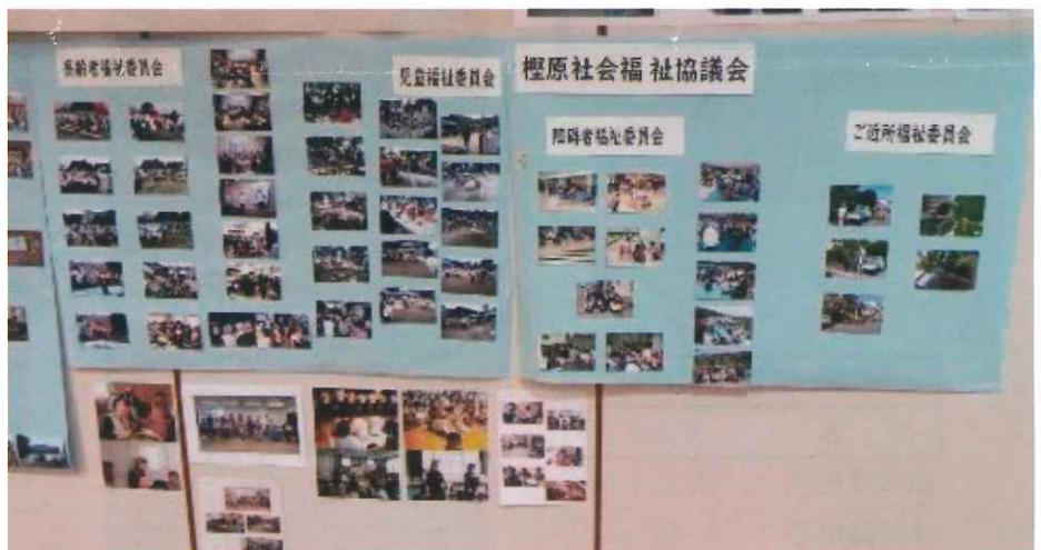
榎原社会福祉協議会は、活動内容を写真パネルで展示