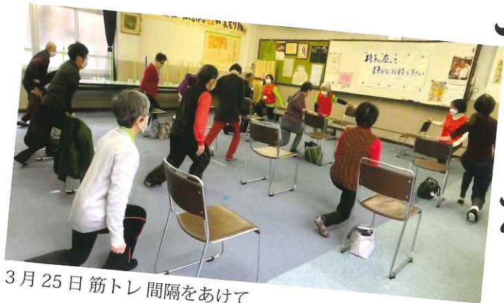
3月25日 筋トレ 間隔をあけて