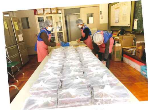
これから町別に数えて袋詰め