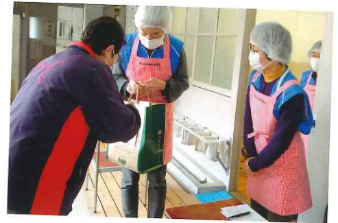
2月15日 配食活動 協力員さんお願いします