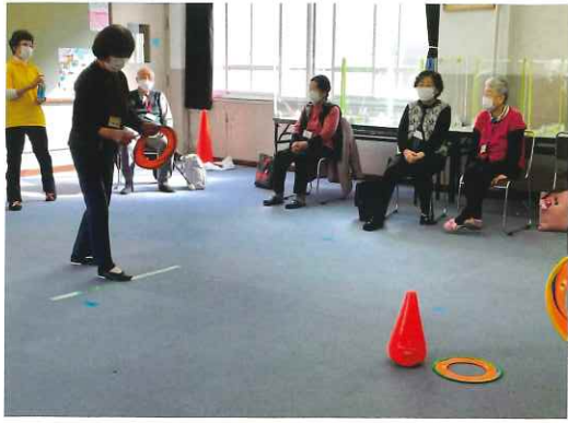
2月8日 健康すこやかサロン