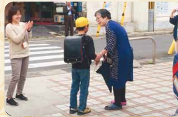
認知症の方への声かけ訓練 (徘徊模擬訓練)