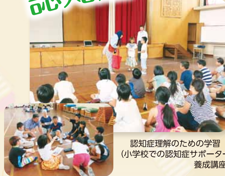
認知症理解のための学習 (小学校での認知症サポーター養成講座)