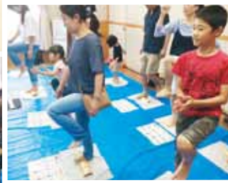
竹踏み運動体験に親子で参加 (「西京健康ひろば」にて)