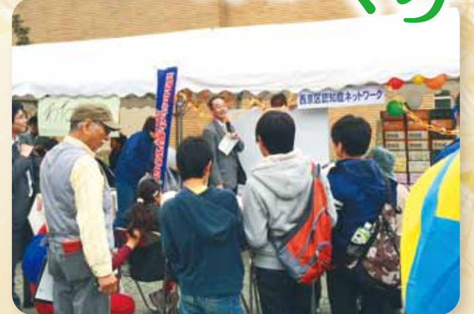
認知症理解のための啓発 (らくさいさくら祭)