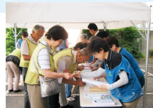
災害ボランティアセンター設置・運営訓練

災害ボランティアセンターの設置・運営訓練や、助けが必要な人を訪問して見守る訓練などを実施し、災害にも強いまちづくりを目指していきます。