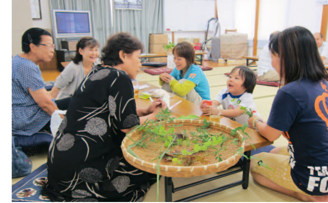
川岡東学区のひまわりサロン

西京区でも、高齢者を対象に100円や200円の参加費で、コーヒーやお茶を飲みながらおしゃべりや会話を楽しむ「喫茶型サロン」などの居場所づくりが広がりつつあります。