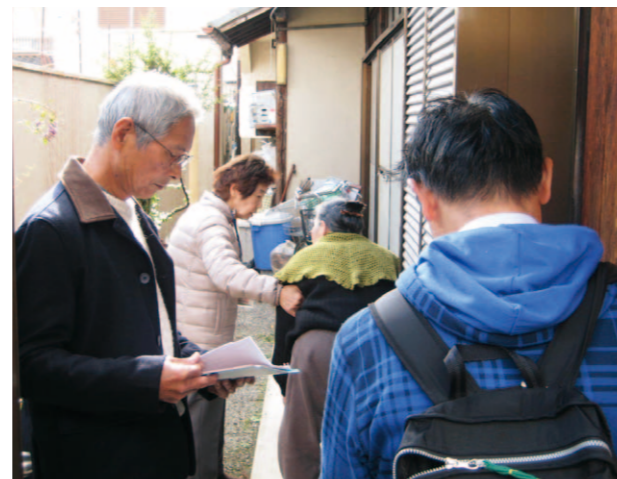
桂徳学区の見守り活動