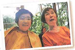
デイサービスの利用者さん