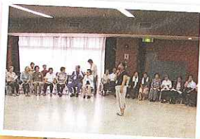
体操実施中！身体を動かすと 気持ちいいですよ