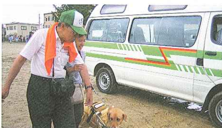
生活福祉資金貸付などの相談