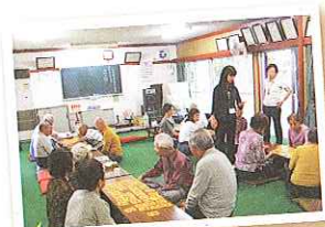
脳トレ実施中！皆で協力し ながら知恵をしょります