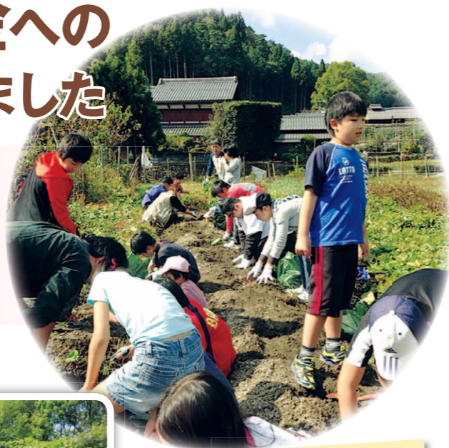
障がいのある方の交流 (野外活動)