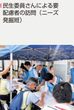
民生委員さんによる要配慮者の訪問(ニーズ発掘班)