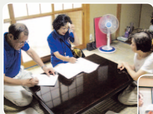
ボランティア活動希望者の受付(ボランティア登録班)