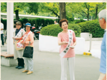
▲共同募金街頭啓発