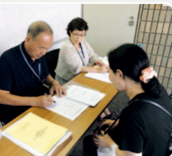
被災者からの困りごとの受付(ニーズ受付班)