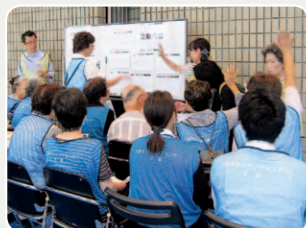
ボランティア活動先の調整(コーディネート班)