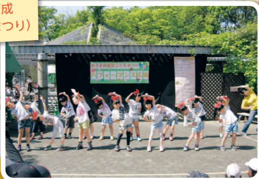
児童の健全育成 (西京・こどもまつり)