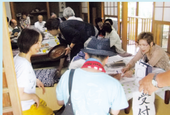
桂東サロンの様子

区内の4ヶ所で新たな居場所が開設されました。近くにお住まいの方はぜひご来場ください。