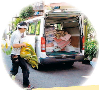
高齢者の見守り (寝具クリーニング活動)