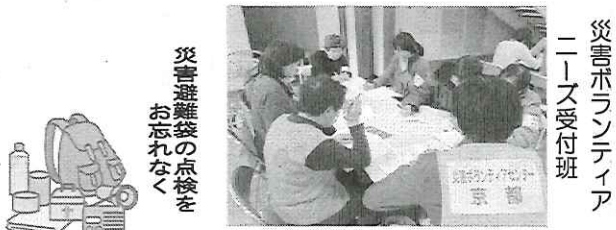
災害避難袋の点検をお忘れなく

阪神・淡路大震災や東日本大震災でも被災後の生活再建において、災害ボランティアの活動が目されましたが、西京区においても、災害発生時にボランティアによる組織的な支援が必要な状況と判断された場合、西京区長からの要請により、「災害ボランティアセンター」を設置・運営することになっています。