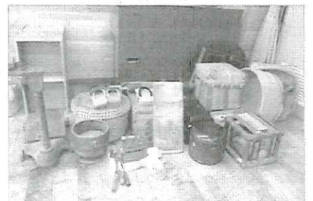
昔の道具体験2クラス担当の男性ボランティアさん