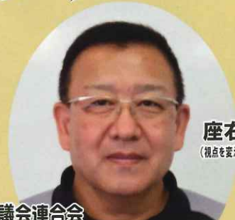
座右の銘：創意工夫 (視点を変えてみることの大切さをこの言葉は表現しています)