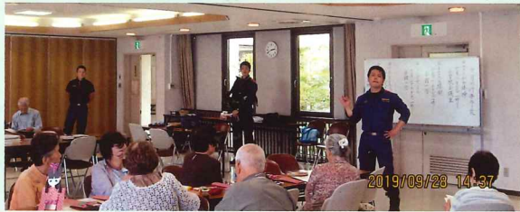
身につまされるお話が多かったです。