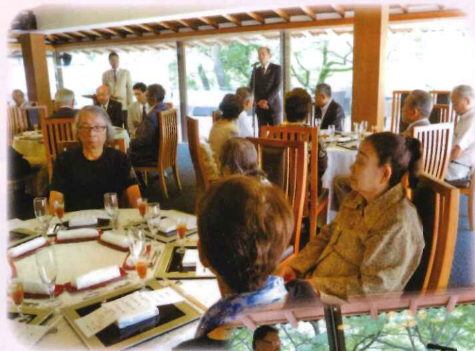
鷹峯 しょうざんで 美味しい料理を 頂きました