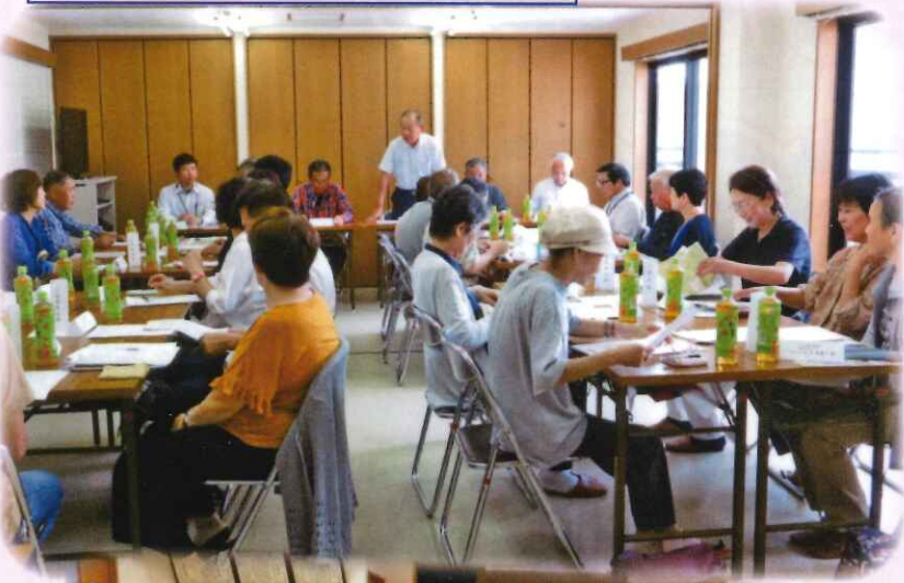
見守り活動 地域の高齢者を訪問 結果を報告 10月6日(土)