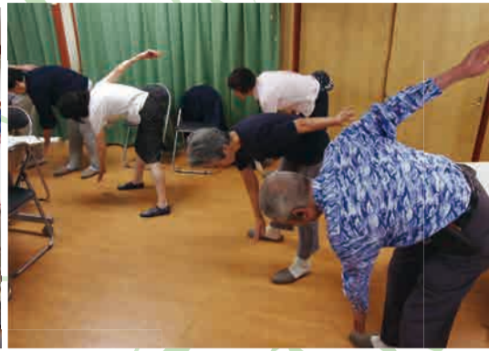
▲ みなさん、まだまだ身体が柔らかい