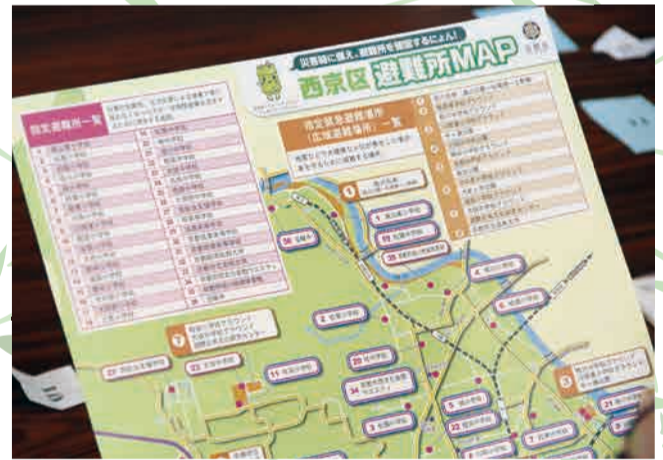
▲ 「西京区避難所MAP」持ってますか!!