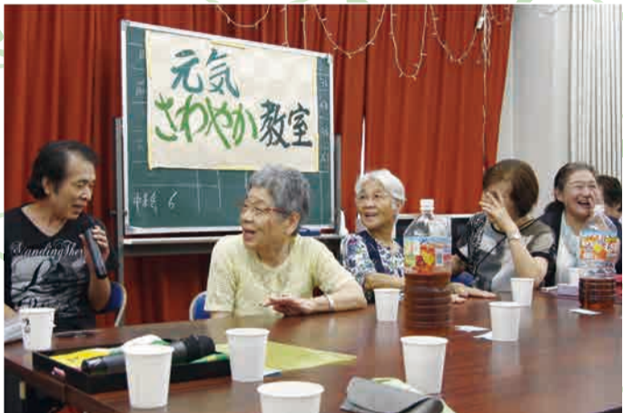
◀ 期せずして始まったカラオケ独演会 口ずさむ人、聞きいる人、 笑いの止まらない人...