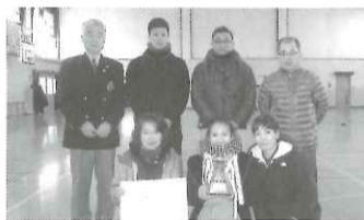
平成29年度 区民卓球大会 優勝 滝ノ下チーム