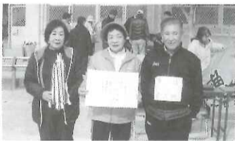
平成29年度 区民ベタンク大会 優勝 東山台チーム