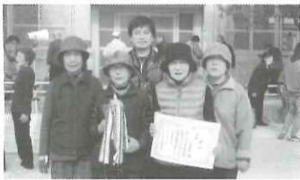
平成29年度 区民グラウンドゴルフ大会 優勝 上里町チーム