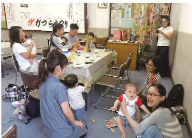
いっぽ七夕の会 7月5日