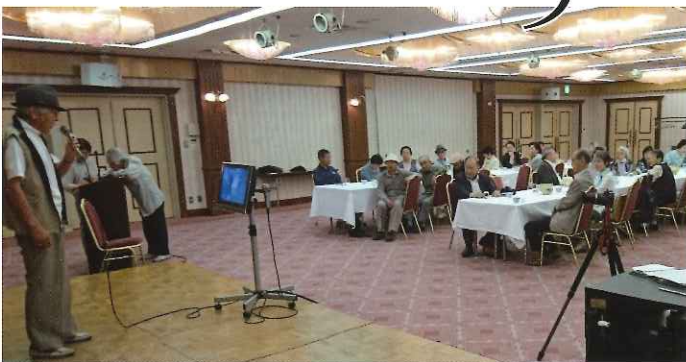
食事会・カラオケの集い 6月15日