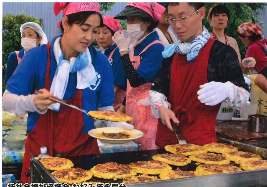
桂社会福祉協議会「お好み焼き屋台」

社会福祉協議会は まつりも盛り上げます! 社会福祉協議会（社協）は毎年夏に行われる「ざ・かつらまつり」にも最高に熱い屋台を出店しています。地域のみなさんのおなかをいっばいに、さらに心も熱く燃え上がらせるお手伝いをさせてもらっています。 暑い夏に熱いお好み焼きを食べて、身も心もホットになったところでぜひ社会福祉協議会にご協力をお願いいたします。来たれ若人！社協が求めているのはそんな熱い人材です。 興味のある方は気軽に声をかけてください。