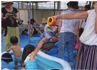
おやこひろば 7月20日