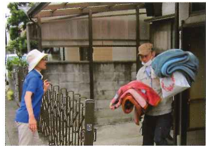
ふとんクリーニング 7月25日