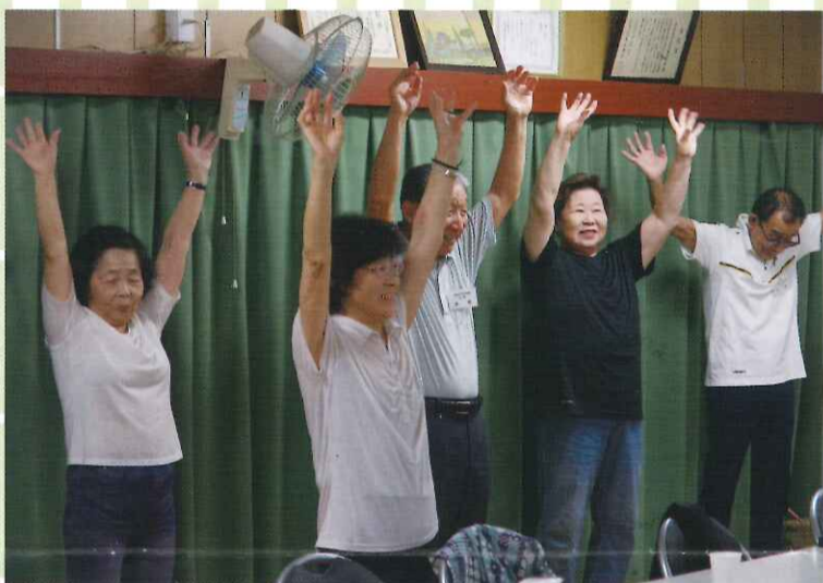
▲ 健康チェックの後は、体をほぐします。 ▼ うまく動かない身体に思わず苦笑い!!