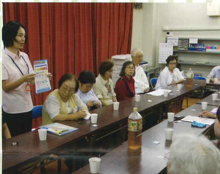
▲ 地域包括支援センターの方から健康や日常生活に役に立つお話し 6月のテーマは「熱中症」