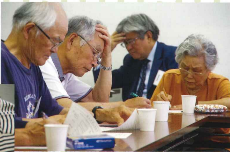
▲ 難問に思わず難しい顔で頭をかかえて... こんなに真剣に考えるのは学生の時以来?