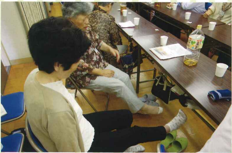
▲ 介護予防体操のミニ講習!?