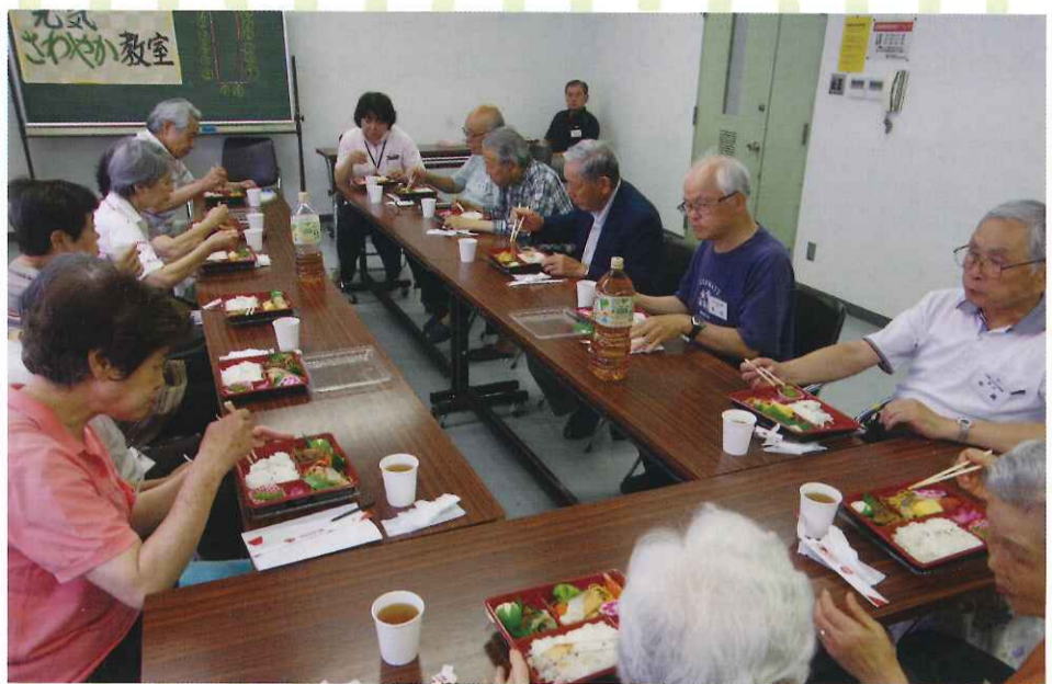
▲ 食事は、みんなでお話ししながら食べるのが美味しい