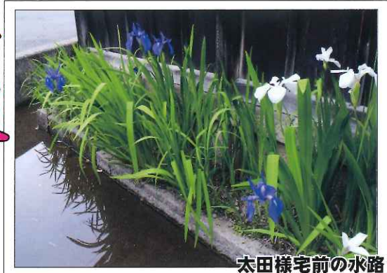
太田様宅前の水路