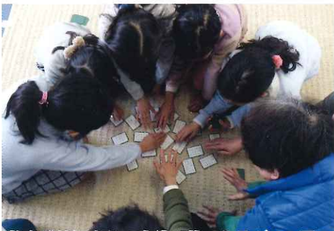
桂小学校児童との交流「昔のあそび」3月11日