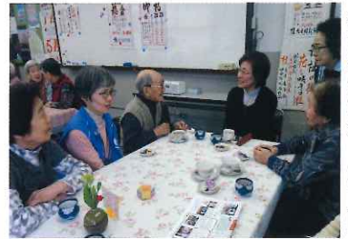
ふれあい喫茶 3月1日