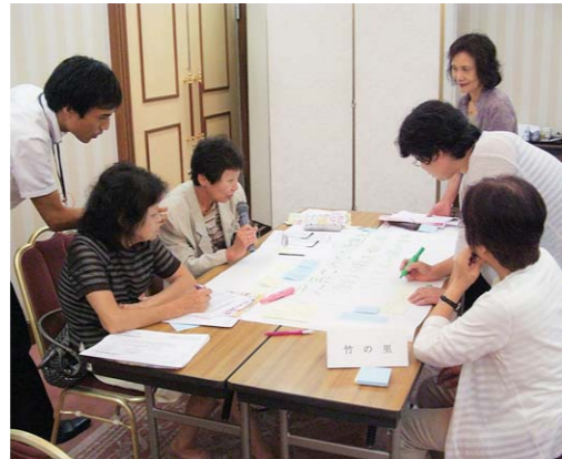
重点目標づくりのワークショップ

「相談の取り組み」（新林学区）、「要配慮者の見守り活動」（桂徳学区）の報告をいただき、その後、各学区に分かれて、重点目標づくりのワークショップ（意見交換）を行いました。 ワークショップでは、学区毎に「地域の課題」や「地域の強み」を出し合いながら、今後5年間で重点的に取り組む活動目標について意見を交わしました。 各学区では、策定された重点目標のもと活動を進めていきます。（各学区の重点目標は下記を参照）